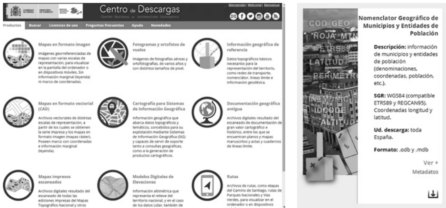
Figura 2. Acceso a la página de Descargas del CNIG- Información Geográfica de Referencia-NGMEP.

Además de la base de datos, se publica su correspondiente metadato y una memoria descriptiva de la estructura, datos y fuentes de la información publicada.