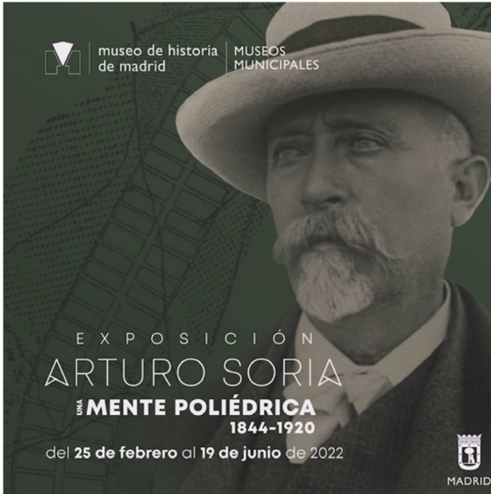
Figura 3. Portada del catálogo de la exposición conmemorativa del centenario de Arturo Soria, organizada por el Ayuntamiento de Madrid y abierta en el Museo de Historia de Madrid entre febrero y junio de 2022.

tividad y calidad de los materiales integrantes de la exposición reproducidos en la última parte del libro, algunos de ellos inéditos –documentos, posters, fotos, postales, etc.–, lo que a buen seguro será de gran utilidad para futuros trabajos de investigación y divulgación sobre la figura irreplicable de tan polifacética personalidad en tantos aspectos un ejemplo para la presente y futuras generaciones de españoles (figura 3).