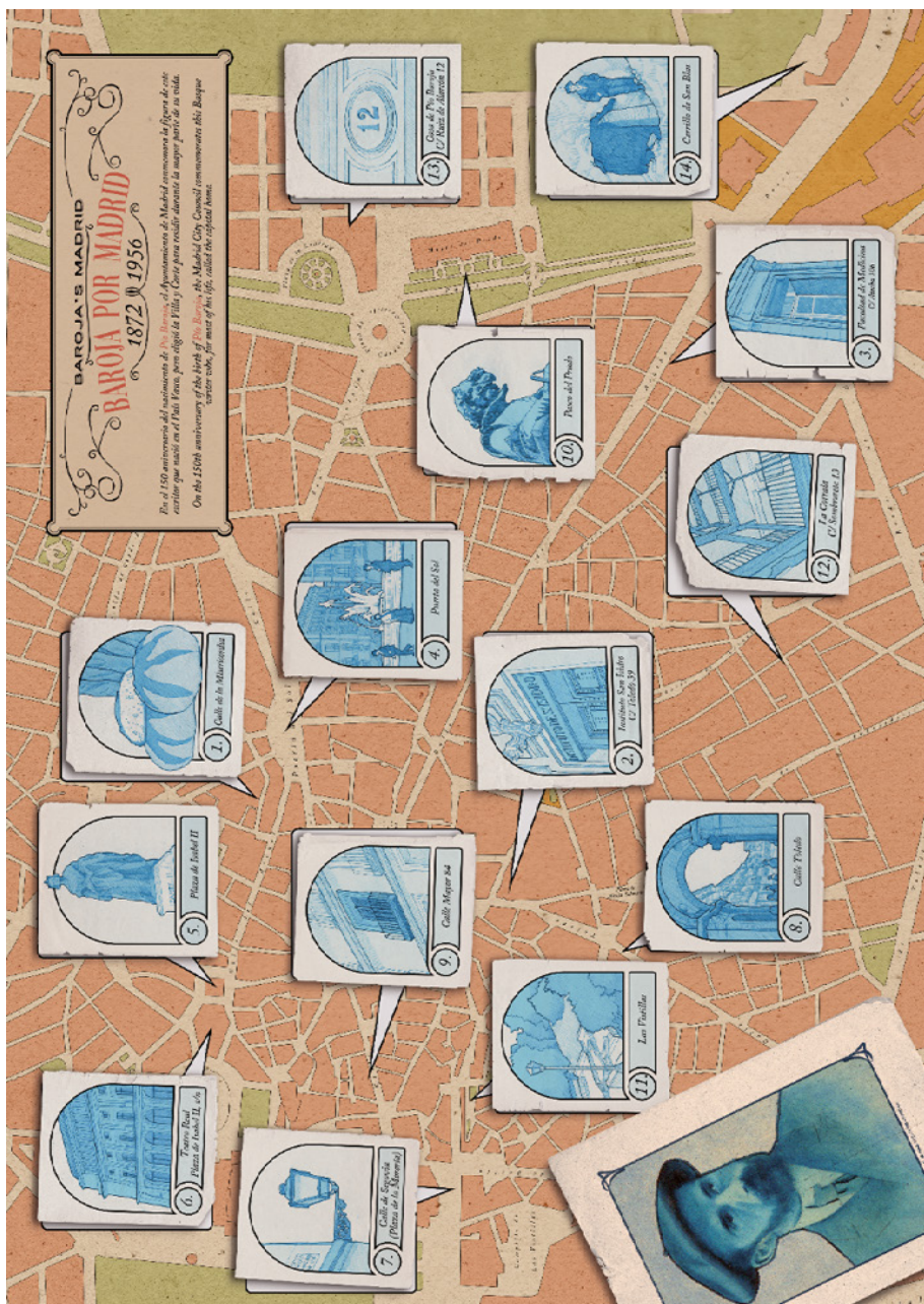
Figura 5. Plano ilustrado del sector de Madrid vinculado a la vida cotidiana de Pío Baroja y de sus personajes de ficción.