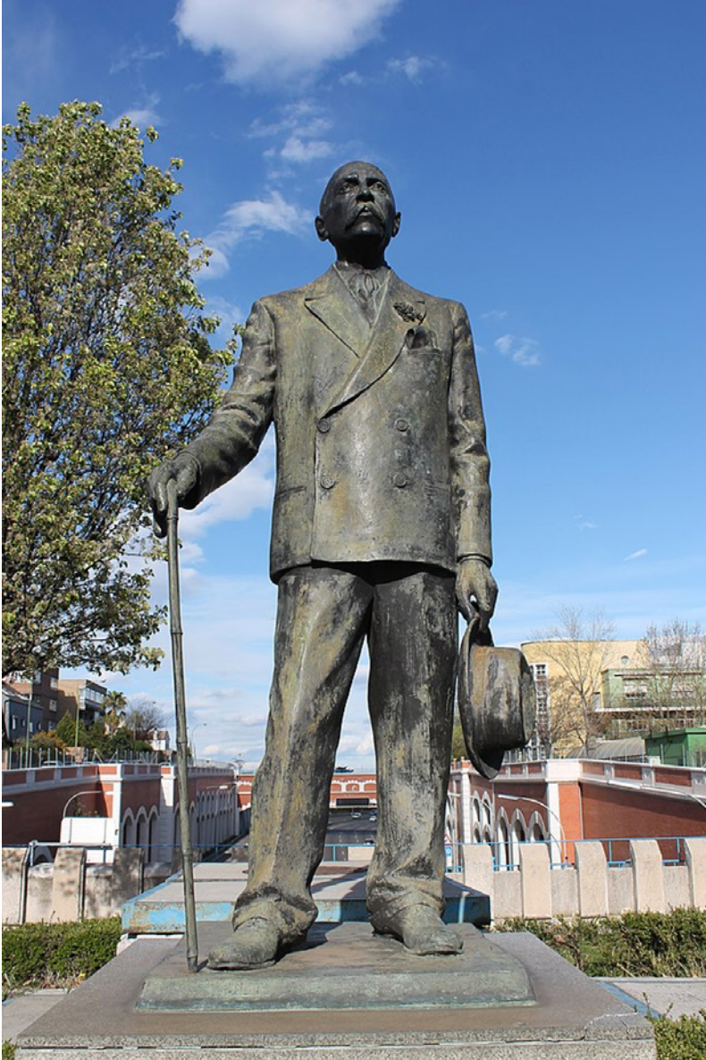
Figura 1. Estatua de Arturo Soria en la confluencia de la calle homónima con la avenida de América.