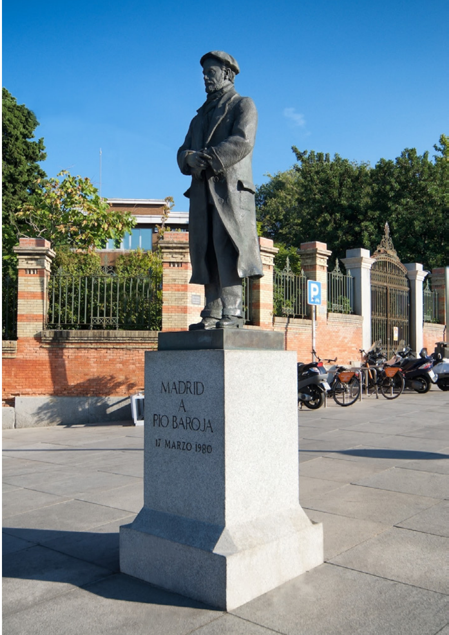
Figura 4. Estatua de Pío Baroja erigida por el Ayuntamiento de Madrid en la cuesta de Moyano junto al Jardín Botánico y en el acceso al parque del Retiro.