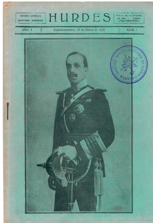
Figura 1. Portada del primer número de Hurdes . Revista Católica quincenal ilustrada , de 15 de marzo de 1926.

momento las Hurdes, la cual terminaría alimentando toda una leyenda negra, cuyo rastro perdura en la memoria colectiva de los habitantes de la comarca.