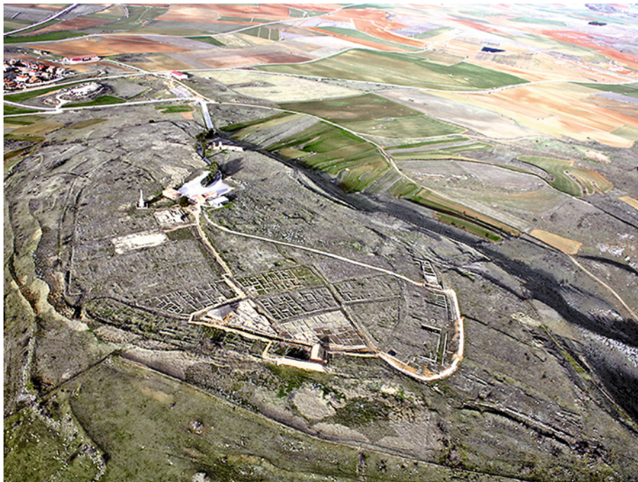
Figura 2. Vista aérea del yacimiento de Numancia (2016)

más diversos lugares de esa España interior en los prolegómenos de las elecciones generales del 28 de abril de 2019 2 (Figura 2).