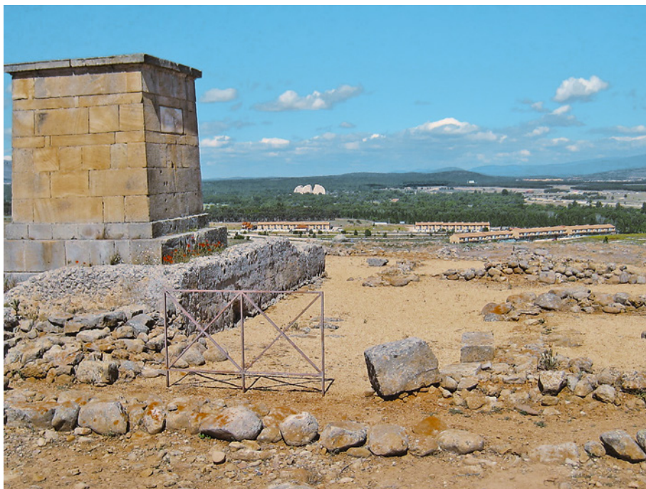
Figura 4. Vista del Soto de Garray desde Numancia (en primer plano), con urbanización en el centro y las Cúpulas de la Energía inacabadas al fondo de la foto.