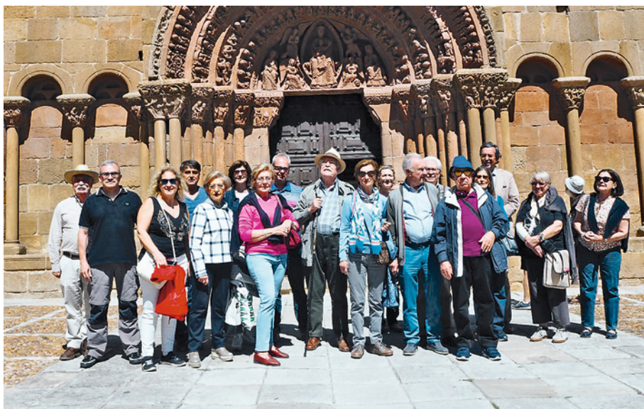
Figura 8. Fachada de la iglesia románica de Santo Domingo con el grupo de la RSG.