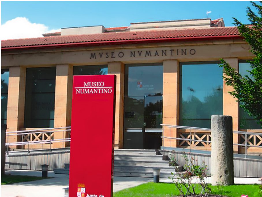
Figura 7. Fachada del Museo Numantino, inaugurado en 1919.

carretera y ferrocarril. Sin embargo, tras involucrarse en el proyecto las instituciones especializadas en la gestión de suelo tanto a nivel regional (GESTUR-CAL) como estatal (SEPES) y los habituales retrasos que entrañan las obras de urbanización y su tramitación administrativa, parece ya haberse despejado el horizonte para la recepción parcial de la urbanización del flamante polígono industrial. Tal futurible estaría ya muy próximo, según información reciente de la prensa local ( Heraldo-Diario de Soria , 28.10.2019) 10 , abriéndose así la puerta a la comercialización de parcelas para que las empresas vengan a instalarse al nuevo espacio industrial (Figura 7).