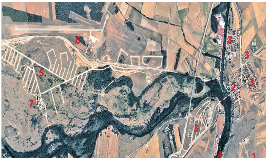
Figura 6. Entorno geográfico del yacimiento de Numancia organizado en torno al río Duero y su afluente el Tera. Referencias: 1. Yacimiento de Numancia. 2. Casco histórico de Garray. 3. Urbanizaciones. 4. Río Duero y Soto de Garray. 5. Ciudad del Medio Ambiente, reconvertida en Parque Empresarial del Medio Ambiente (en tramitación). 6. Aeródromo de Soria. 7. Cúpu-las de la Energía.

Elaboración propia (diseño: Juan de la Puente).