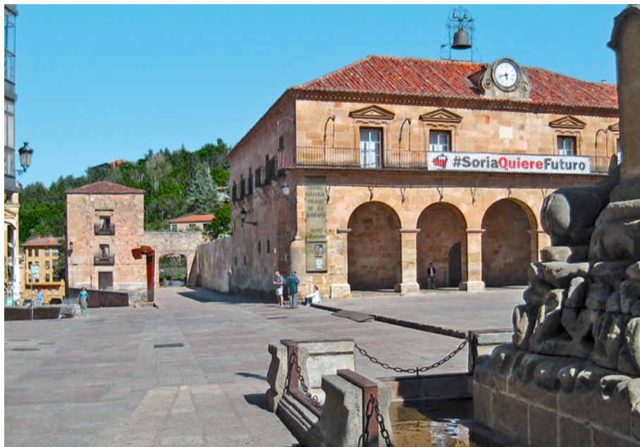
Figura 11. Plaza Mayor de Soria con Torre de Doña Urraca (al fondo) y Palacio de la Audiencia con pancarta reivindicativa en la fachada.

ción, D. Amalio de Marichalar, ponderó el gran respaldo obtenido por la declaración de Numancia entre instituciones culturales y académicas españolas y extranjeras y recalcó los muchos y potentes argumentos que la justifican en atención a los valores universales que la defensa de la ciudad celtíbera representa. Completó la mesa redonda la intervención del profesor Manuel Valenzuela, presidente de la mesa y vicepresidente de la RSG, quien ponderó el potencial impulso que la declaración de Numancia como Patrimonio Mundial supondría al atractivo turístico de Soria y de su provincia en el marco de la actual revalorización del turismo cultural 14 . A continuación, se leyó el escrito de respaldo a la candidatura de Numancia como Patrimonio Mundial de la UNESCO suscrito por la Junta Directiva de la Real Sociedad Geográfica en la persona de su presidente D. Juan Velarde con fecha 28 de junio de 2016 y se concedió la última palabra para cerrar el acto al Sr. Marichalar (Figura 11).