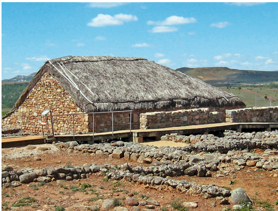
Figura 3. Detalle del yacimiento arqueológico de Numancia: recreación de una casa romana.

Real Soriana Oriental en su camino desde los pastos de Oncala y San Pedro Manrique hacia los de la submeseta Sur y Andalucía 6 (Figura3).