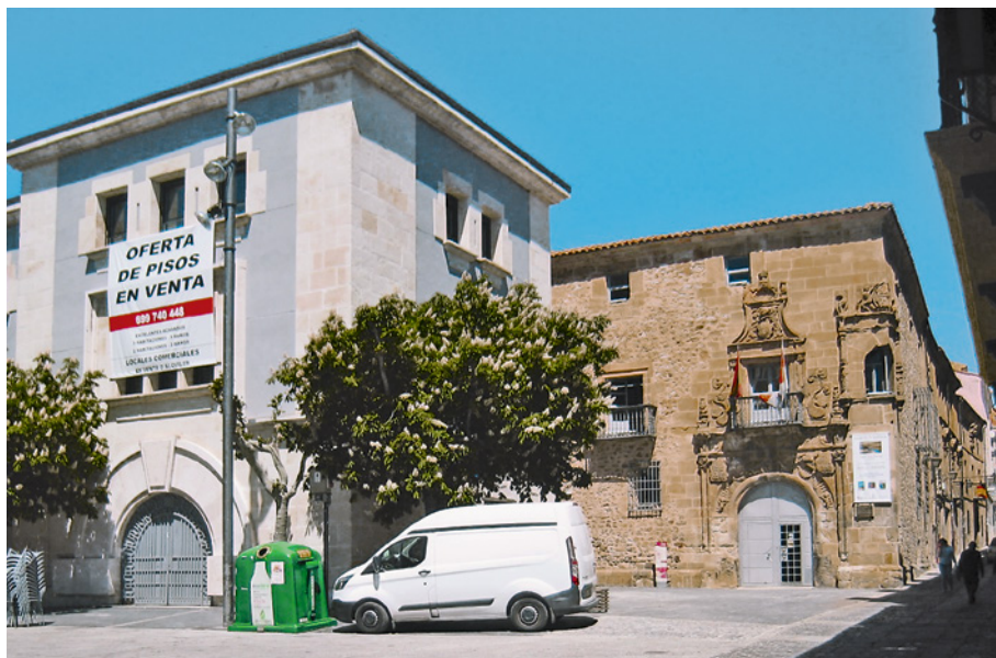
Figura 10. Perspectiva de la calle de la Aduana Vieja en el casco antiguo de Soria. En el centro de la foto: Palacio de los Ríos y Salcedo, actualmente sede del Archivo Histórico Provincial.