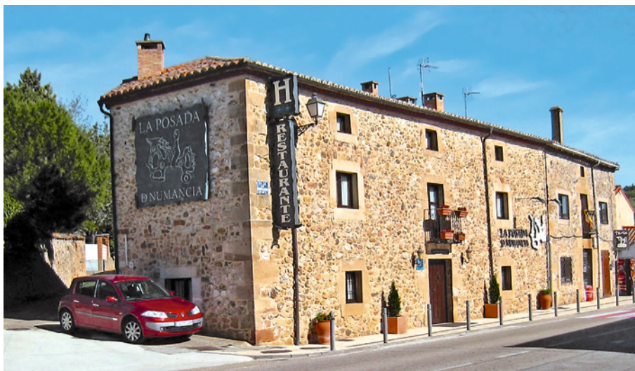
Figura 5. Construcciones del casco de Garray adaptadas al turismo rural (Posada y restaurante).

Merece párrafo aparte uno de los más elocuentes ejemplos de «ruina inmobiliaria», aportada precisamente por la lamentable historia de la CMA. Se trata de las Cúpulas de la Energía , edificio destinado a convertirse en el icono arquitectónico de la CMA y que también quedó inmerso en la misma vorágine judicial del conjunto. Paralizada la obra por los jueces del TSJ de CyL y decretada su demolición en 2013, ésta fue anulada posteriormente también por decisión judicial y actualmente se halla pendiente de la decisión final del TC sobre el conjunto del PEMA. Lo que ya será muy difícil de eliminar son los importantes impactos sobre el medio natural y cultural del Soto de Garray 9 a causa de la urbanización realizada ni el gasto de 93 millones de euros en la obra civil del proyecto (redes, viario, depuradora, aparcamientos etc.), 52 de los cuales sólo en la construcción de las Cúpulas de la Energía , actualmente inacabadas y paralizadas. En el supuesto de que se llegaran a concluir, las previsiones que se barajan son o bien alquilar sus espacios a pequeños promotores o bien especializarlas, de manera que uno de los módulos se destinarían a formación, otro a usos administrativos del propio parque empresarial y el tercero a uso expositivo; hoy por hoy puras especulaciones (Figura 6).